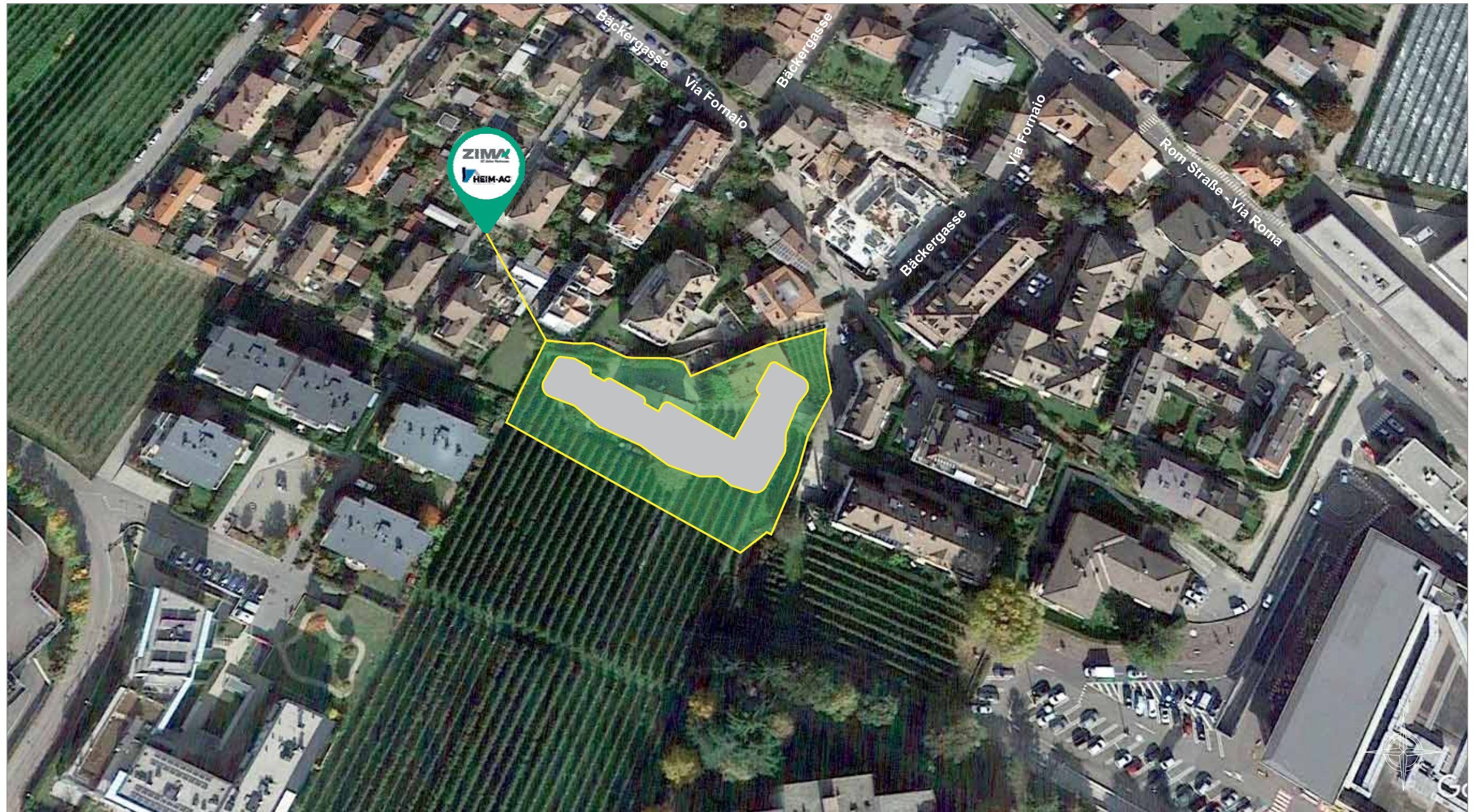
LAGEPLAN | PIANTA

Meran - Bäcker-gasse Nr. 11 - Merano via Fornaio n. 11