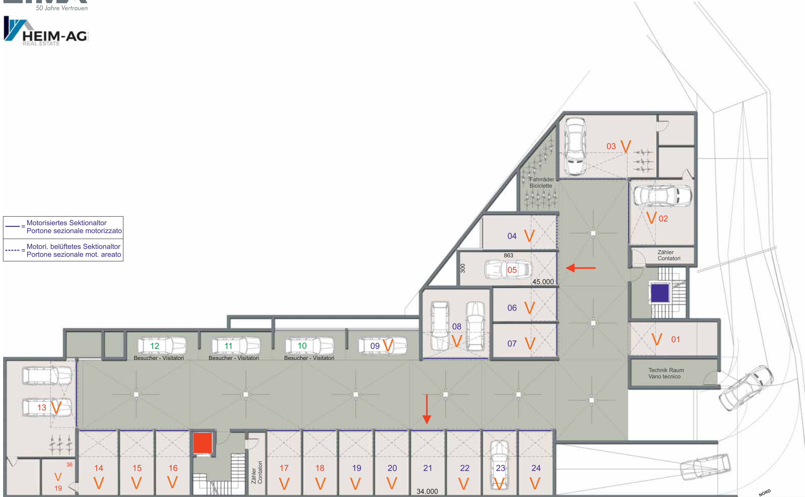
1. UNTERGESCHOSS | 1° PIANO INTERRATO